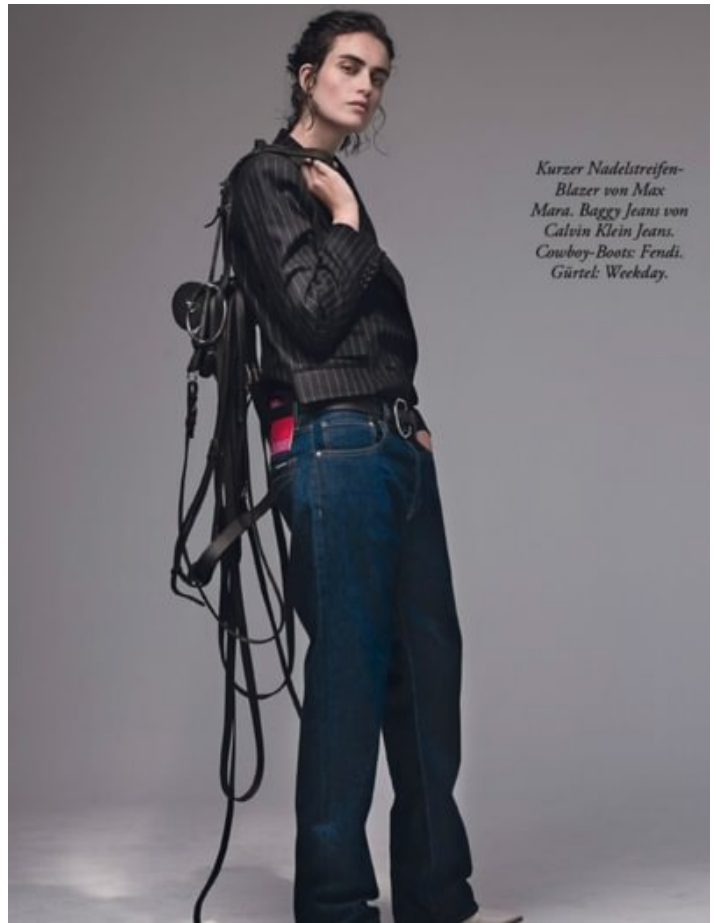
Kurzer Nadelstreifen- Blazer von Max Mara. Baggy Jeans von Calvin Klein Jeans. Cowboy-Boots: Fendi. Gürtel: Weekday.