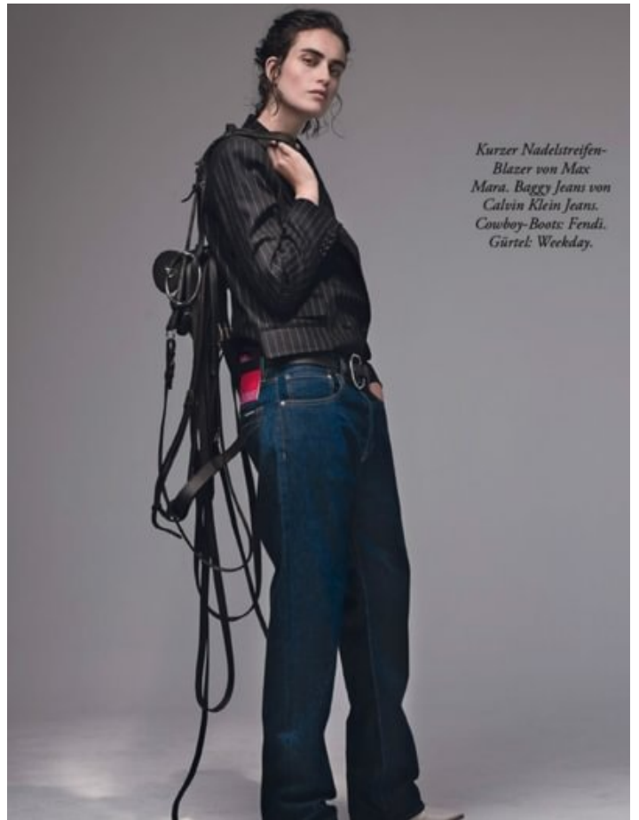
Kurzer Nadelstreifen- Blazer von Max Mara. Baggy Jeans von Calvin Klein Jeans. Cowboy-Boots: Fendi. Gürtel: Weekday.