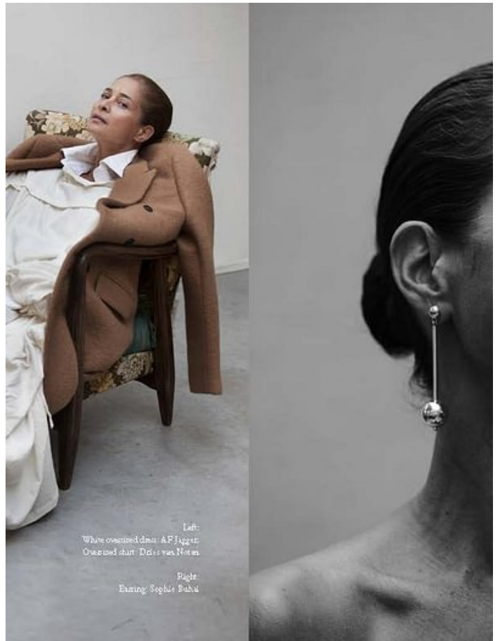
Left: White oversized dress: A.F. Jagger Oversized shirt: Dries van Noten