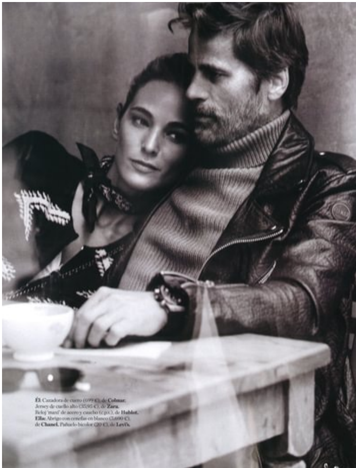
El Cazador de cuero (0998) de Colson. Jersey de cuello alto (2295 C) de Zara. Biker 'man' de acero y cuero (c.p.) de Habbat. Elia: Abigo con correa en blanco (1490 C) de Chanel. Pulido-bicolor (20 C) de Levi's.