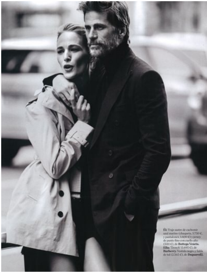
Él: Traje suéter de cachemir azul marino (chopista, 3.750 €), y pantalones, 1.600 € y jersey de punto fino con cuello alto (500 €), de Bottega Veneta . Ella: "Trench" (1.695 €), de Barberry ; Vestido negro y falda de tul (2.365 €), de DaguerreE2 .