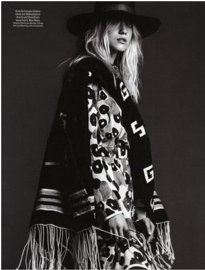
Knochenlanges Seiden- kleid mit Maximalisten- druck und Knistflur- auschnitt. Max Mara, Original: http://www.maxmara.com die auf http://www.maxmara.com