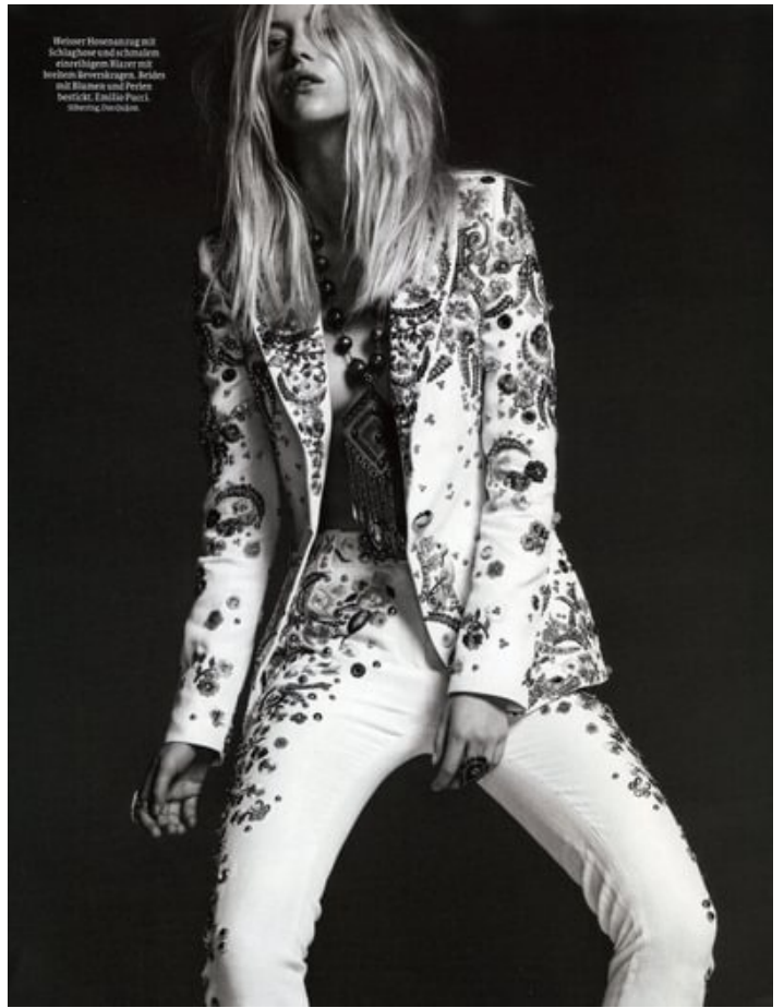
Hellerer Hosenanzug mit Schlingener und schmetter- lingsartigen Bläser mit besten Bevertüchern, Seiden mit Blumen und Perlen bestickt, Emilio Pucci, Shirley, David La