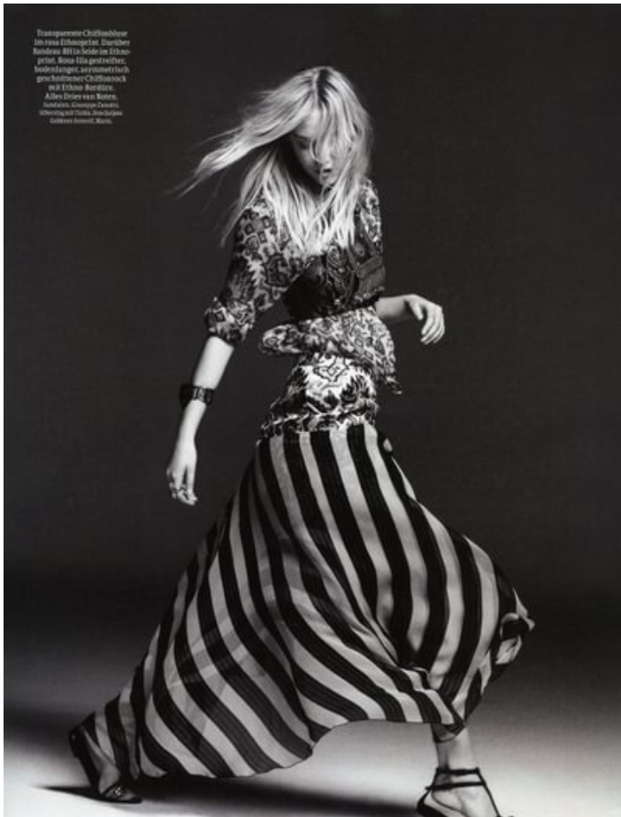
Transparente Chiffonbluse im reinen Ethnosstil. Durchsicht Reinweiß. Billie Selby im Ethno- print. Rosa Lisa gestreift. Hedera Langen. In Kombination mit großformatiger Chiffonbluse mit Ethno-Print. Alena Dorn von Berlin. Hedera Langen. Chiffon-Print. www.hedera-langen.com www.alena-dorn.com