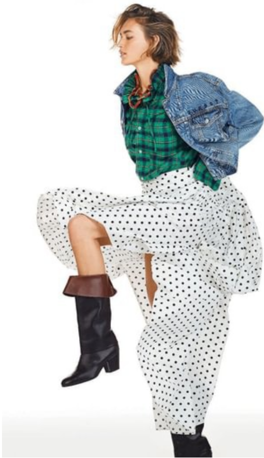
Giacco di denim con logo ricamato, Guess Jeans (119,90 euro), camicia di cotone tartan (46,60 euro) e maxi gonna di cotone a pois (79,00 euro), tutto Plan C, collana di metallo e smalto Cobalt, stivali di pelle con rinvoltito a contrasto Chisari. Nella pagina accanto: Giacca di shearling con inserti di velluto trapuntato e denim, fardi (4.500 euro), orecchini di metallo