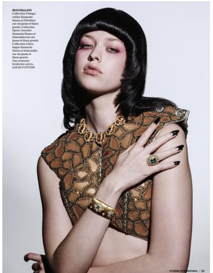
BUCCELLATI Collection Yonage : collier diamants blancs et trébolites sur ors jaunes et blancs gravés. Collection Opere : bracelet diamants blancs et émeraudes sur ors jaunes et blancs gravés. Collection Univo : bague diamants blancs et émeraudes sur ors jaunes et blancs gravés. Top croquer broderies cuivre, LOUIS VUITTON