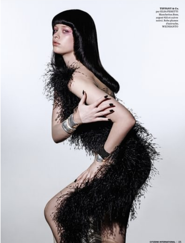
TIFFANY & Co. par ELSA PERETTI Manchettes Rose, argent 925 et cuivre mince. Bague plumes d'autruche, WEINSANTO