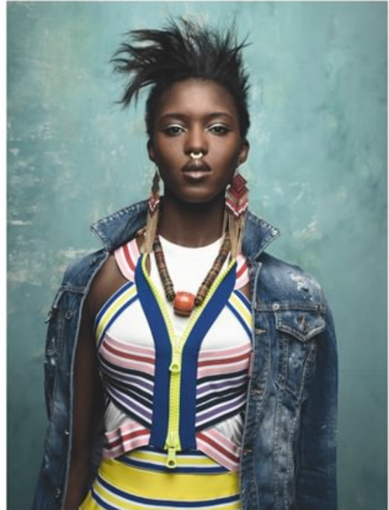
À gauche : veste en Nylon, KARL LAGERFELD . Bouton-gorge en cuir, ZARA BAYNE . Pantalon en denim, ROBERTO CAVALLI . Châleux dans les cheveux et autour du cou, SAPP'S . Bagues, CORPUS CHRISTI . Montres, ROLEX . Collier et chaussures, GIUSEPPE ZANOTTI DESIGN . Coiffure et signe de nez vintage. À droite : veste en jean, déboutonné en coton et robe multicolore en coton stretch, DIAGRAMME . Collier, CÉMARÉ . Boutonnière d'épave vintage.