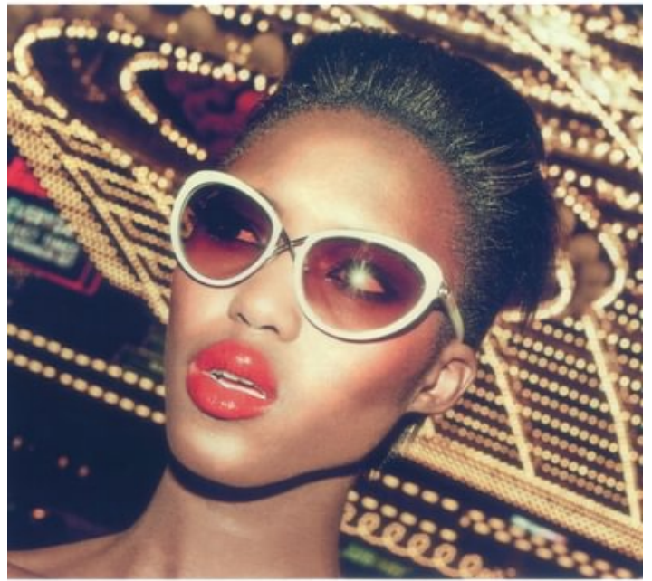
TIM FORD "Charlie" sunglasses in shiny ivory acetate with shiny pale gold metal detailing and gradient lenses. Italy. $450. Male Flower. XI.com